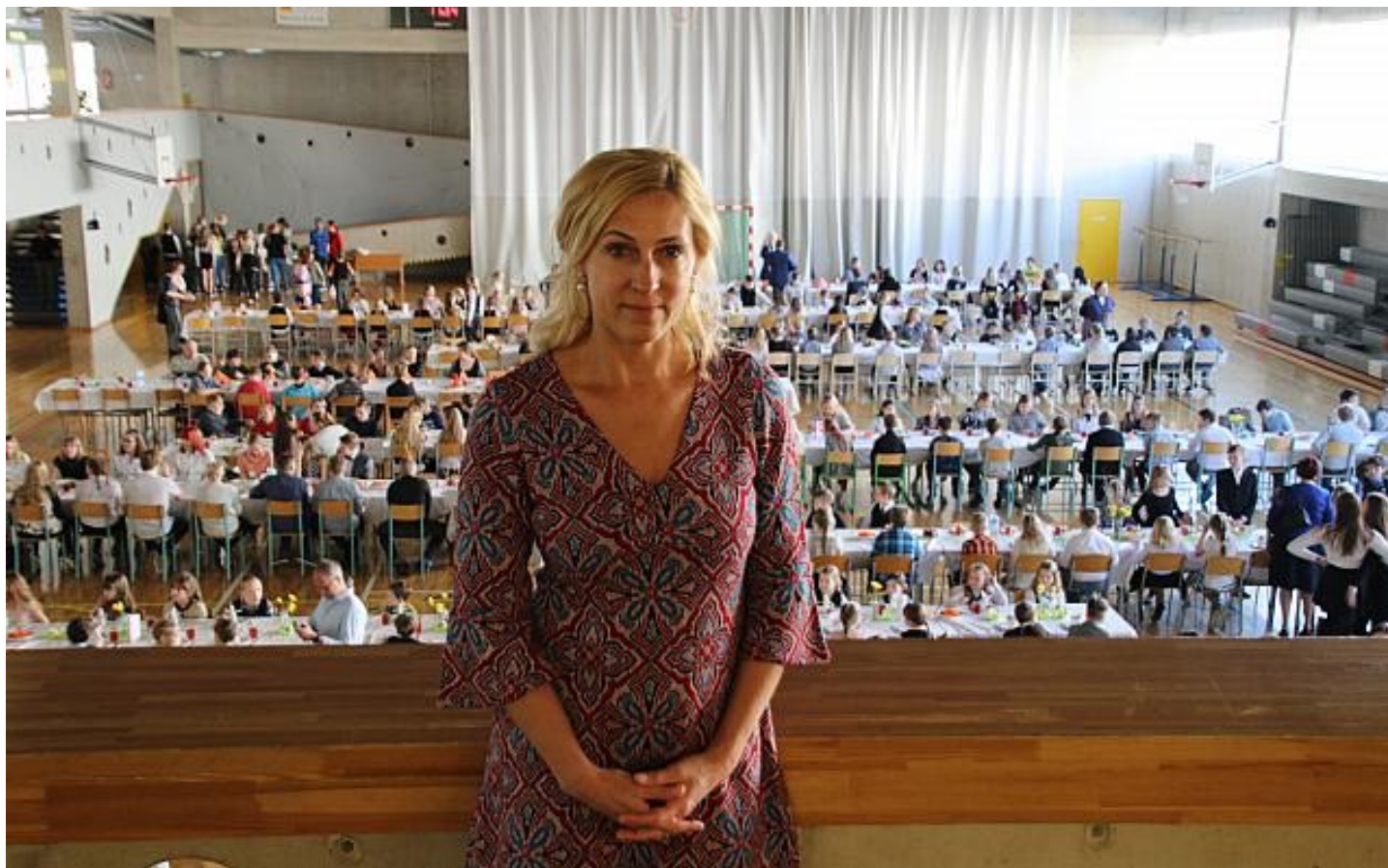
FOTO: Esimest korda meie kooli ajaloos sõi kogu kool korraga.

Fantaasiapäeval degusteerisime eksootilisi puuvilju, mängisime õiglase kaubanduse teemalist mängu, mõtlesime, kuidas iga toit leiaks sööja, valmistasime leiba, kunstiteoseid ja küpsisetorti, saime teada, mis spordialaga peame tegelema, et söödud kalorit ära kulutada. Lõpuks vaatasime koos filmi „Toit – hõrgutav teadus“.