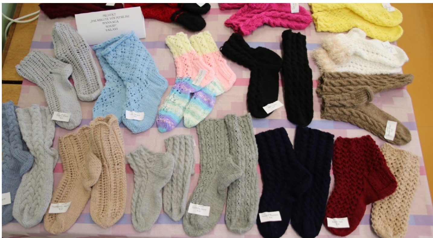
FOTO: Kevadkontserdi ajal on alati võimalik vaadata õpilaste käsitöönäitust. Pildil on 9. klassi tüdrukute kootud sokid.