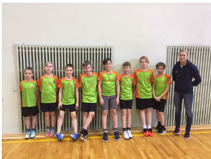
FOTO: Viljandi maakonna 1-3. klasside rahvastepalli võistlustel said poisid II koha ning tüdrukud 4. koha. Fotol poiste võistkond.