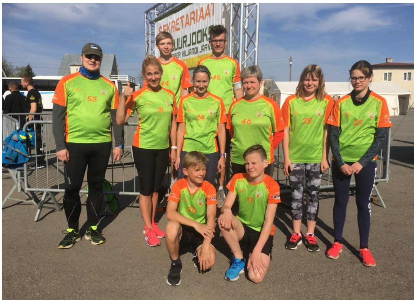
Foto: Suure-Jaani Kooli esindasid ümber Viljandi järve jooksul koos nii õpetajad kui õpilased.

vastutus jäetakse pahatihti tähelepanuta. Meie kõigi oodatav tulemus on arukalt hakkama saav noor, kes ellu astudes vastutab iseenda, oma pere, järglaste ja kogu Eesti tuleviku eest. Seepärast pöörasime sel õppeaastal eriliselt tähelepanu vastutustunde kujunemisele. Oleme teinud küll edusamme, me räägime palju vastutusest, lapsed mõistavad vastutuse olemust ning arutlevad, kuid meil on pikk tee minna, et kõigi tegudest vastutustundlik suhtumine ja julgus võtta vastutus välja paistaks.