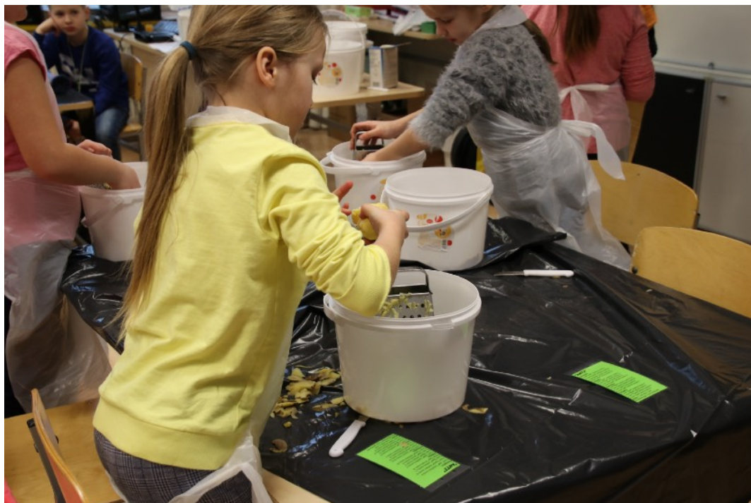
FOTO: Kevadpoolaasta üks uuenduslikumaid ja põnevamaid sündmusi oli toiduteemaline projektinädal. Vajadus muutunud ehk uue õpikäsituse järele on tulnud sellest, et elu ja kool kipuvad teineteisest eemalduma, kuid kooli eesmärk on kasvatada elus hästi toime tulevaid inimesi. Katsetasime tavapärasest erinevaid õpetamis- ja õppimisviise, jätsime kõrvale ainekeskse, teemade kaupa õppimise, ainetunnid ja tunniplaani. Lähemalt projektinädala tegemistest lk 4-5.