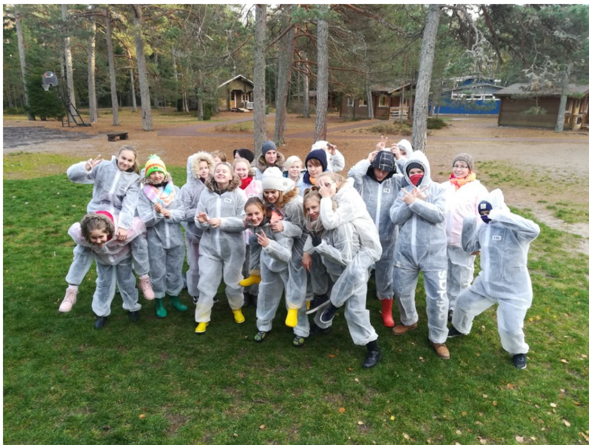
FOTO: 7. klass tegeles inimkatsetega hoolivuse laboris.