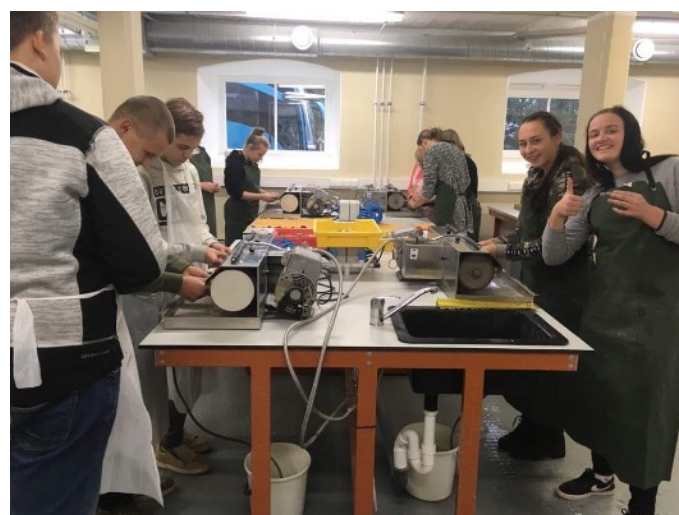
FOTO: 9.a ja 9.b käisid Tallinna Tehnikaülikooli Särghaua õppekeskuses uurimas maakoore ja kivimite koostist.