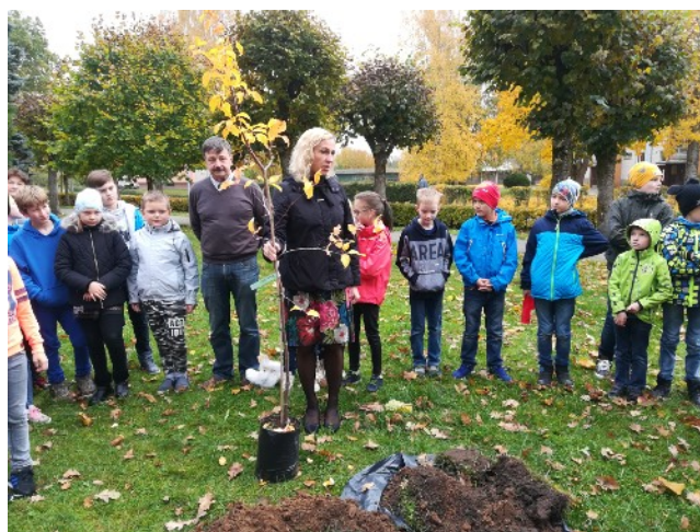
FOTO: Koolihoovi-projekti õunapuu istutamine.