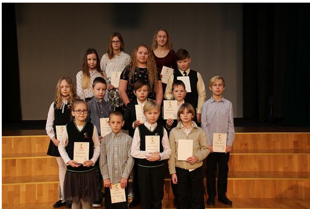
FOTO: I poolaasta lõpuaktusel said kooli tänukaardi 40 õpilast, kelle tunnistusel on ainult viied.

2018/2019. õppeaasta üldeesmärk on õpipädevuse ja enesemääratluspädevuse arendamine . Õpipädevus tähendab seda, et oskame õppida ja usume, et õppimine on meile kasulik. Enesemääratluspädevus tähendab seda, et tunneme ennast, oma tugevusi ja nõrkusi ning otsime võimalusi, kuidas paremaks inimeseks saada.