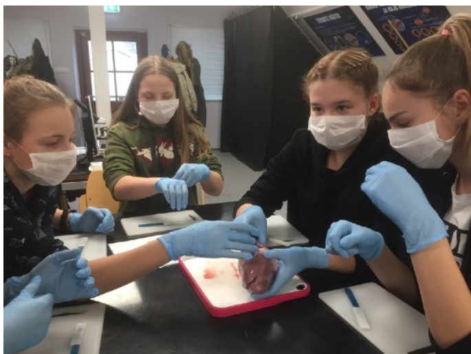
FOTO: 6. ja 7. klass osalesid Rakveres Eesti Politseimuseumi programmides.