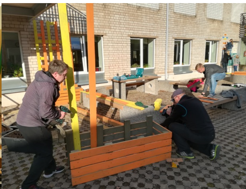
FOTO: Rohelise koolihoovi talgutel läks vaja ka isade abi, et kujundada koolihoov mitmekülgsemaks ja ligitõmbavamaks. Meie kool peab oluliseks, et vahetunnid veedetakse õues.

9. klass võttis osa Viljandi Kutseõppekeskuse ning Olustvere Teenindus- ja Maamajanduskooli lahtiste uste päevadest.