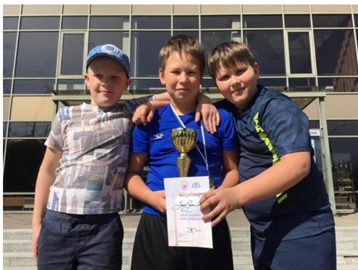
FOTO: Maakondliku vabamaadluse võistluse võistkond.