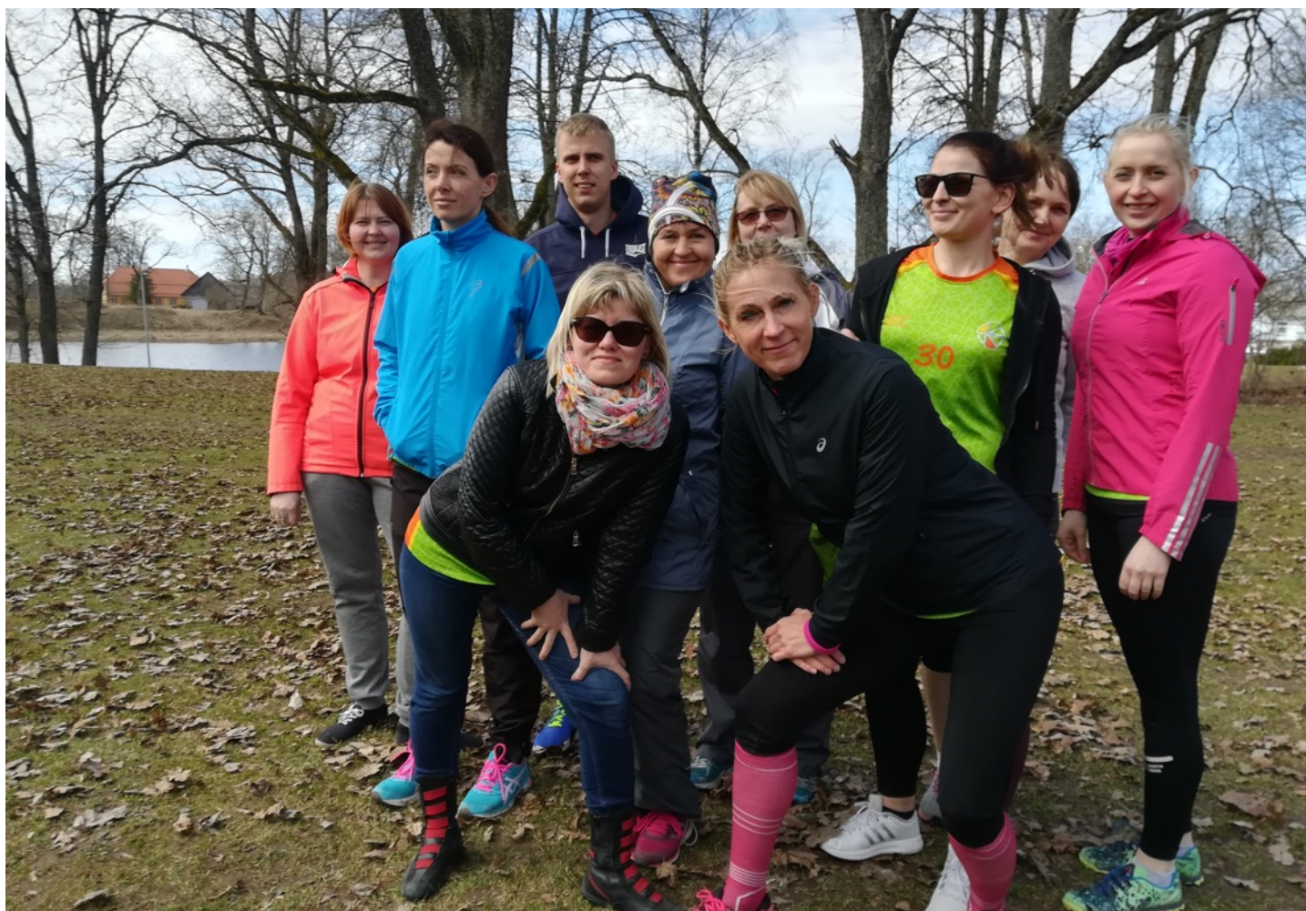
FOTO: Suure-Jaani Kool on tervist edendav kool. Peame liikumist ja aktiivset eluhoiakut väga tähtsaks. Pildil on õpetajate ümber järve jooksu võistkond