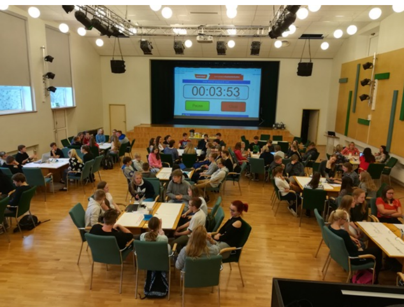
FOTO: Osaluskohvikus arutati, mis on meie koolis puudu ja kuidas seda parandada, kuidas igaüks saaks kooliellu panustada ja mille poolest on meie kool hea.

algklasside eestvedamisel kooliõue kujundamise talgud, mis olid üks osa EV100 projektist „ Lapsed koolihoovi liikuma ja õppima! “ Vanemad aitasid kooliõuele luua põnevaid ajaveetmise ja mänguvõimalusi. Vanemad olid kutsutud ka osaluskohvikusse , milles õpilased alates 6. klassist tegelesid koolielu oleviku ja tulevikuga.