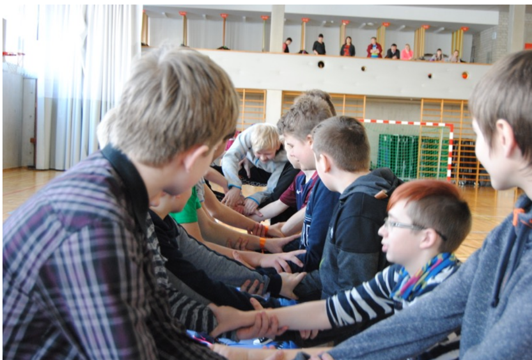
FOTO: 2017/2018. õppeaasta teema oli vabadus ja vastutus. See tähendab ka vabadust tunnetada oma sidemeid ja kuuluvust ning vastutust ühiste eesmärkide täitmise eest.