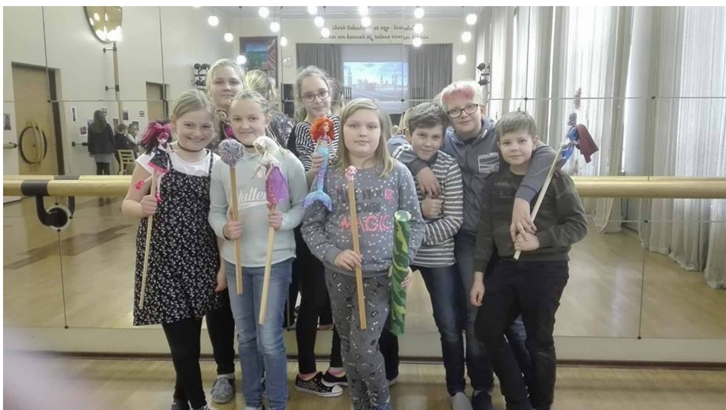
FOTO: Maakonna algklasside inglise keele päev.

Viis 5. klassi õpilast osalesid vabariiklikul väikeste kodu-uurijate võistlusel .