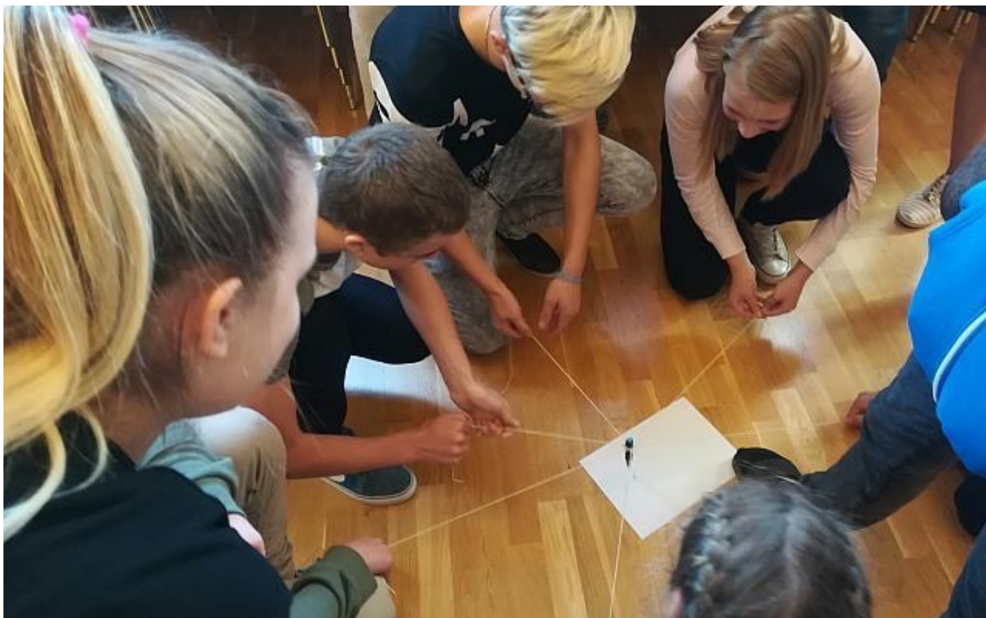
FOTO: Koostööskuse ja kannatlikkuse pani TEKi sünnipäeval proovile meeskonnakirjutamise ülesanne: pliiatsi küljes oli mitu pikka nõõri, millest ühiselt kinni hoides ja mida juhtides pidid paberile saama loetavad tähed.