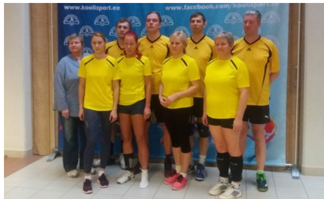
FOTO: Õpetajate võrkpallivõistkond.