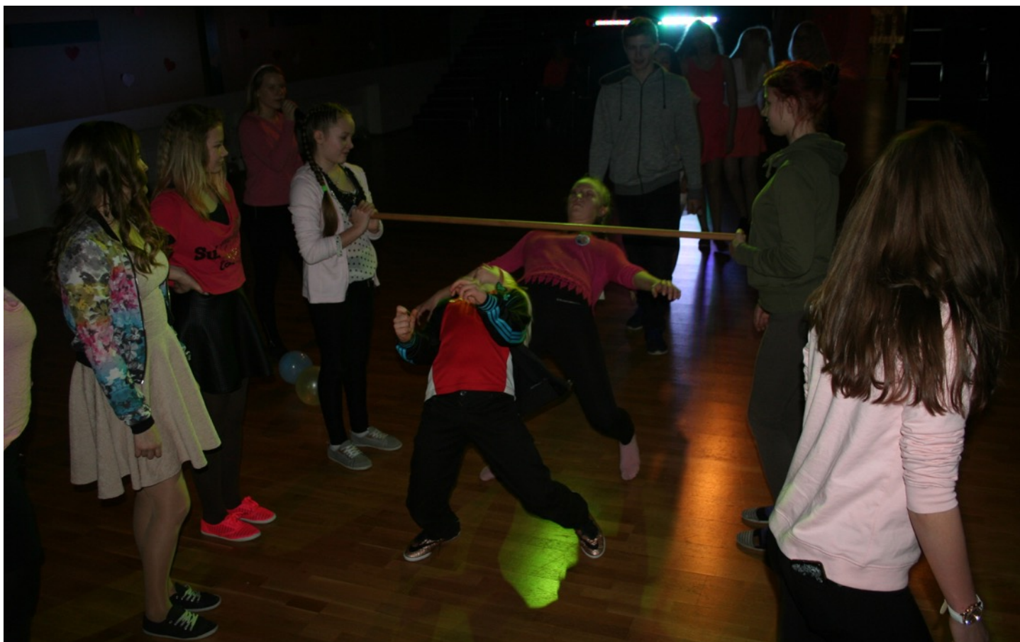
Sõbrapäeval tantsiti meie kooli pidude vaieldamatut lemmikut limbot.