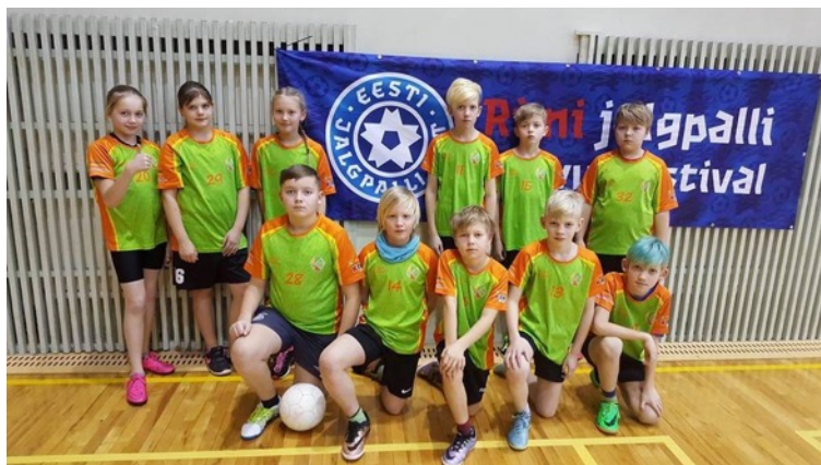
Meie kooli esindus jalgpalli osavusfestivalil.