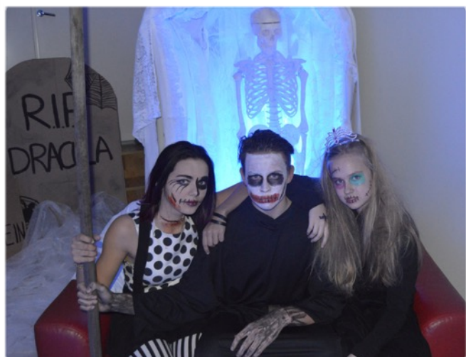
Halloweeni-peo fotonurk oli populaarne.

“Õpilasesindus ei ole ainult kusagil käimiseks mõeldud, vaid ka ise tehakse midagi ära.”