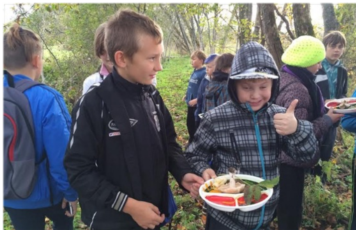
5. klass Tipu Looduskoolis uurimas, kes keda sööb.

Toreda kingituse said septembris 1.a klassi õpilased: lastevanemate eestvedamisel õmmeldi Olustvere käsitöökojas kõigile lastele istumispadjad .