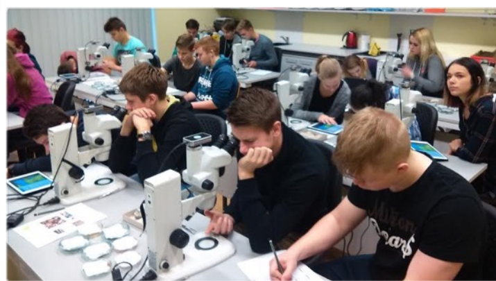
9. klassid Särghaua õppekeskuses.